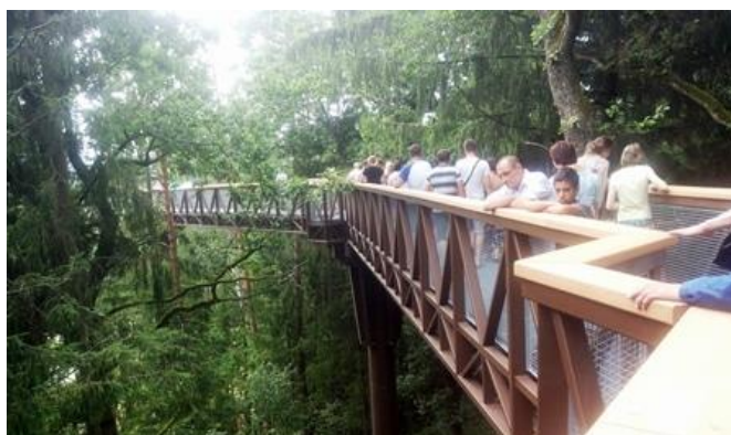
Kiti spėjo aplankyti išgarsėjusį Anykščių šilelio lajos taką