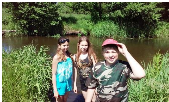
Kai kas vasarą praleido prie mylimo Merkio