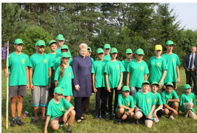
Stovykloje pas šaulius lankėsi LR prezidentė D. Grybauskaitė