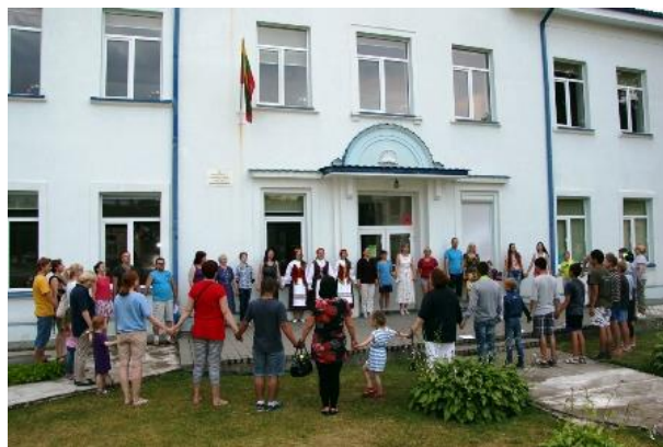
Liepos 6-ąją Baltosios Vokės miestelio žmonės drauge su viso pasaulio lietuviais giedojo „Tautišką giesmę“