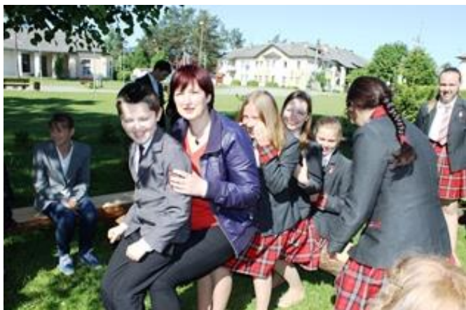
Taip linksmi palydėjom senuosius mokslo metus ir pasitikom vasarą...