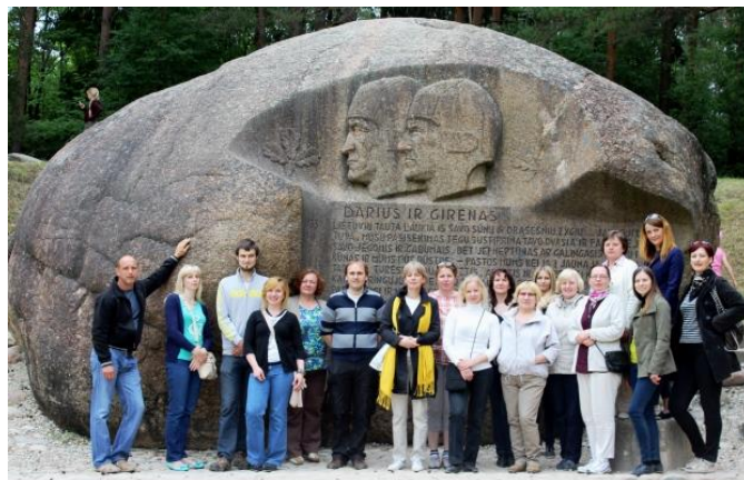
Mokytojų kelionė į Anykščių kraštą (prie Puntuko akmens)